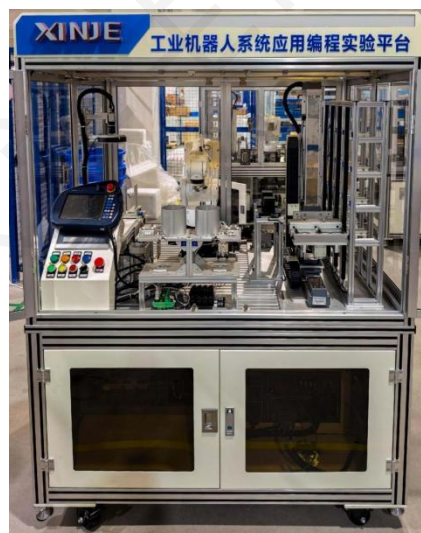
工业机器人系统应用编程实验平台