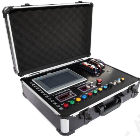
可编程控制器系统应用实验箱